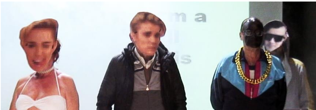
Euphoria in five acts Antic Teatre, Barcelona 2015